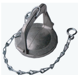
➤ Bouchon symétrique simplifié, à poignée et chaînette