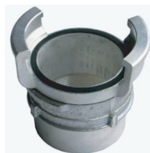
➤ Jonction symétrique à verrou, femelle DN