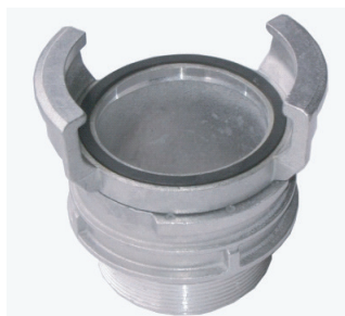
➤ Jonction symétrique à verrou, mâle BSP