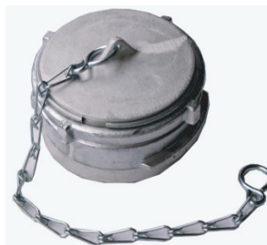
➤ Bouchon symétrique à verrou et chaînette