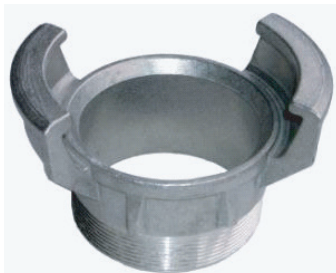
➤ Boîte symétrique, mâle BSP