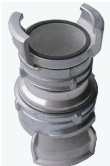
➤ Réduction double symétrique