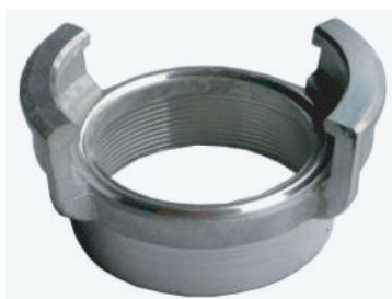
➤ Boîte symétrique, femelle BSP