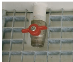
Purge bac de rétention - Caillebotis anti-dérapant