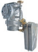
Limiteur de remplissage SOLO ATEX DN80 NF EN13616