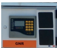
Intégration système de gestion LAFON EasyCarb dans le distributeur