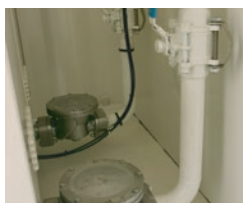
Vanne d'isolement DN40 - Clapet anti-siphon LAFON