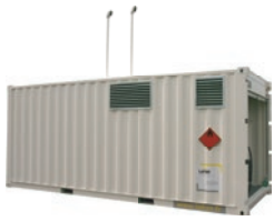
Container 1er voyage