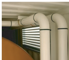
Tuyauterie acier soudé éprouvée