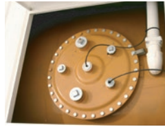
Trappe d'accès trou d'homme de cuve