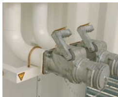
Vanne/clapet de dépotage DN80 cadenassable