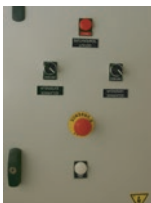
Coffret électrique IP 54