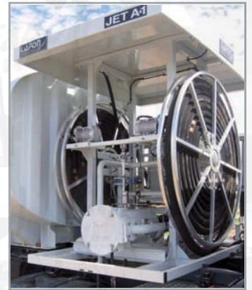
Filtration absorbante ou microfiltre séparateur