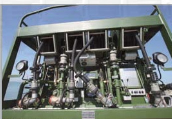
Adaptation des circuits et fonctionnalités à la demande