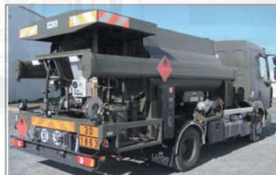
Avitailleur 2950 litres Armée française