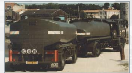
Porteur 12000 + remorque 19000 litres aérotransportables Armée de l'Air

Assistance et services au plan national par les ateliers des SEM 17 & 33 ou notre réseau de partenaires installateurs mainteneurs agréés