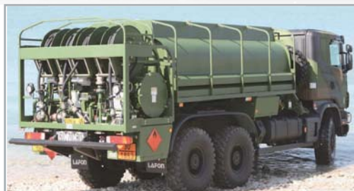
Avitailleur 6X6 10000 litres, citerne acier inoxydable, Armée française