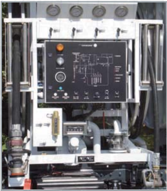
Distribution par accrocheur et par pistolet

avec distribution et/ou reprise de carburant, porteur solo ou ensemble avec remorque JET A1 ou AVGAS 100 LL