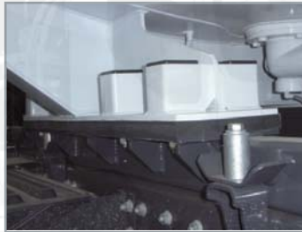
Nouveau système de fixation à la citerne pour répartition optimale des efforts