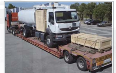
Transport : prise en charge spécifique pour exportation