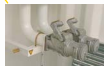
Vanne/clapet dépotage ø 80 cadencassable