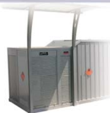
Volet de distribution position fermée