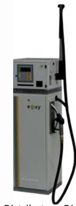
Distributeur Distri'One ATEX 3 ou 5 m 3 /h