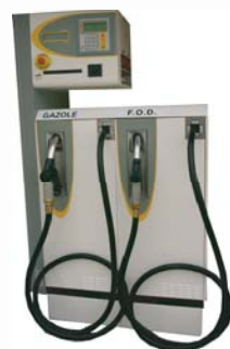
Distributeur Qualys ATEX 3 et/ou 5m 3 /h