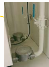
Vanne d'isolement Clapet anti-siphon