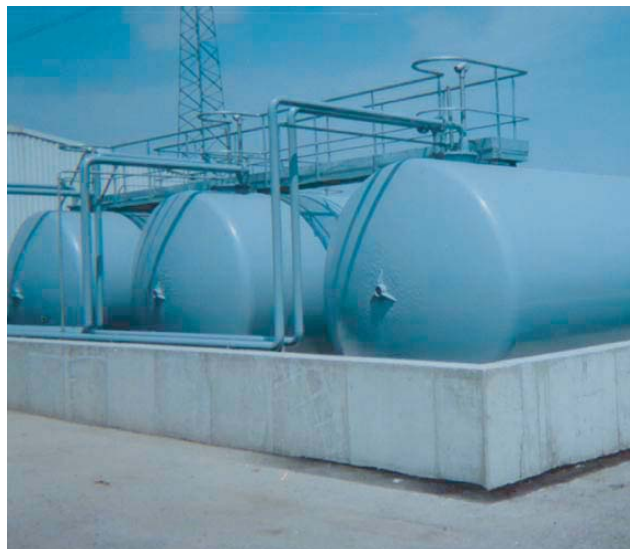
* Présentation avec option RAL appliqué par dessus l'Endoprène

L'assurance qualité pour votre stockage aérien de gazole et de fioul domestique en simple paroi